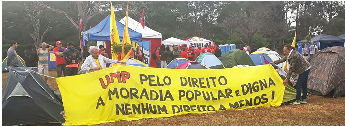
Movimentos de Moradia montam Acampamento Lula Livre em Brasília e promovem aulas públicas sobre temas relacionados à Reforma Urbana

O principal resultado da Marcha Nacional Pelo Direito à Cidade – Reforma Urbana Já!, realizada de 5 a 7 de junho, em Brasília, foi a publicação da Portaria 367/2018, que dá início ao processo de seleção de propostas para o Minha Casa Minha Vida – Entidades. O anúncio se deu após o acampamento e a ocupação do Ministério das Cidades pelos movimentos de moradia e muita pressão sobre o poder público, que finalmente atendeu parte das demandas dos Sem-Teto. No entanto, apenas 10 mil unidades serão contratadas pela nova chamada, número muito aquém das 30 mil previstas na proposta orçamentária de 2018 e das 100 mil reivindicadas pelos movimentos, que seguirão em luta para ampliar as conquistas.