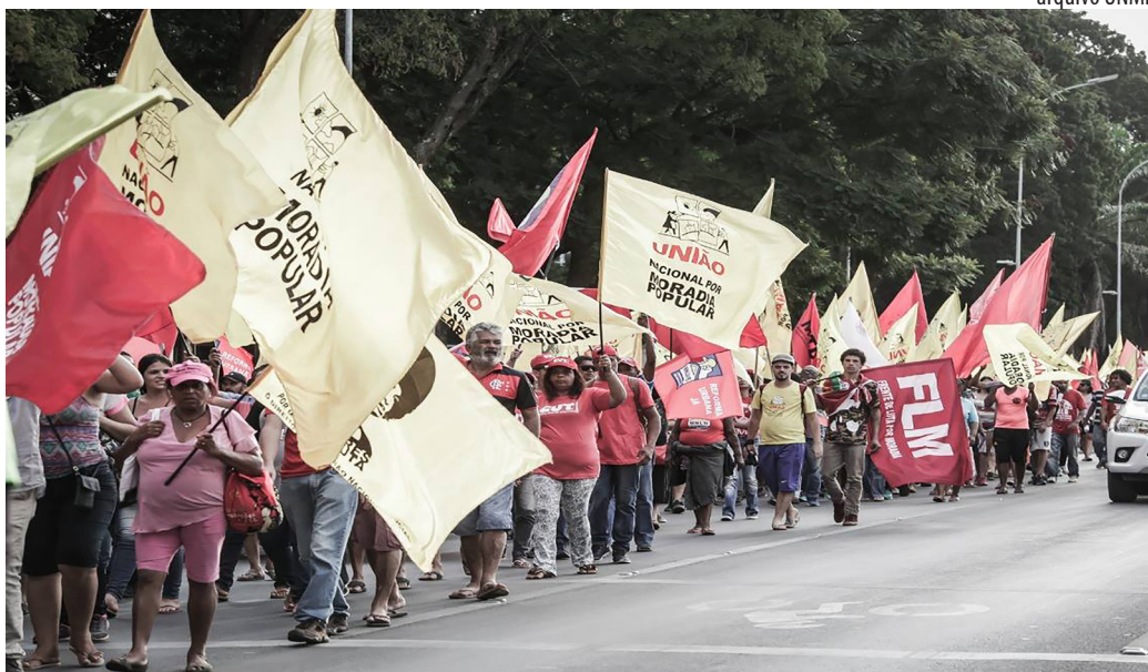
Sem-Teto realizam marcha em Brasília pela retomada da construção da política nacional de habitação e por Lula Livre Já

Entre os dias 5 e 7 de junho, os Sem-Teto realizaram em Brasília (DF) a Marcha Nacional pelo Direito à Cidade – Reforma Urbana Já!, para lutar pela retomada da construção da política nacional de habitação e dos investimentos no Minha Casa Minha Vida-Entidades, dentre outras reivindicações. Após três dias de atividades e manifestações, a Marcha se encerrou com uma ocupação no Ministério das Cidades e com o ministro Alexandre Baldy descendo até o local do acampamento, que atendeu a parte das exigências dos movimentos, com o anúncio de uma nova portaria de contratação do Programa Minha Casa, Minha Vida Entidades (MCMV-E) e da retomada do Conselho Nacional das Cidades. A presença do Ministro na plenária final dos movimentos só foi possível após muita luta, com a ocupação do Minis-