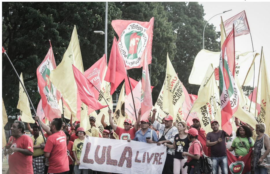
Marcha Nacional pelo Direito à Cidade realiza atos em Brasília por Reforma Urbana e defende a liberdade de Lula

Os três dias de Marcha Nacional pelo Direito à Cidade – Reforma Urbana Já! ficaram marcados pela realização do Acampamento Lula Livre, com centenas de barracas dos militantes dos movimentos de moradia posicionadas ao lado da Catedral de Brasília e em frente ao Ministério das Cidades. Os participantes organizaram diversas atividades, tais como o ato contra as privatizações de serviços de saneamento, energia e da Caixa Econômica Federal; as aulas públicas sobre Mobilidade Urbana, Democratização das comunicações, Conflitos Fundiários, Plataforma BRCidades e contra a revisão do marco legal do saneamento.