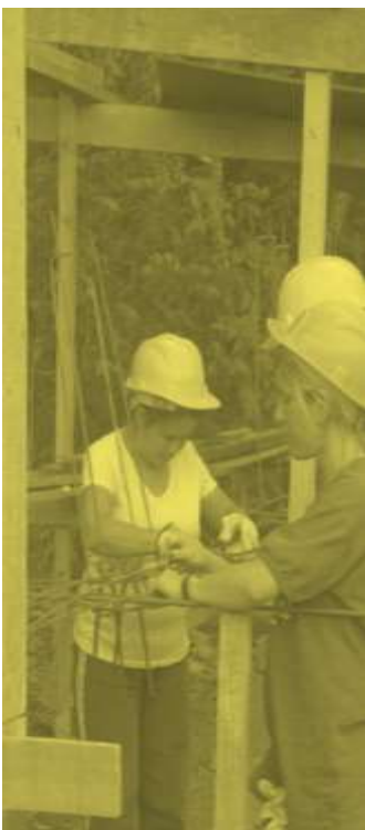
13. Encontro Nacional de Moradia Popular