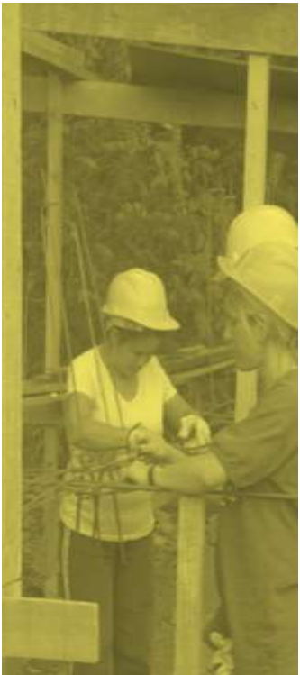
13. Encontro Nacional de Moradia Popular