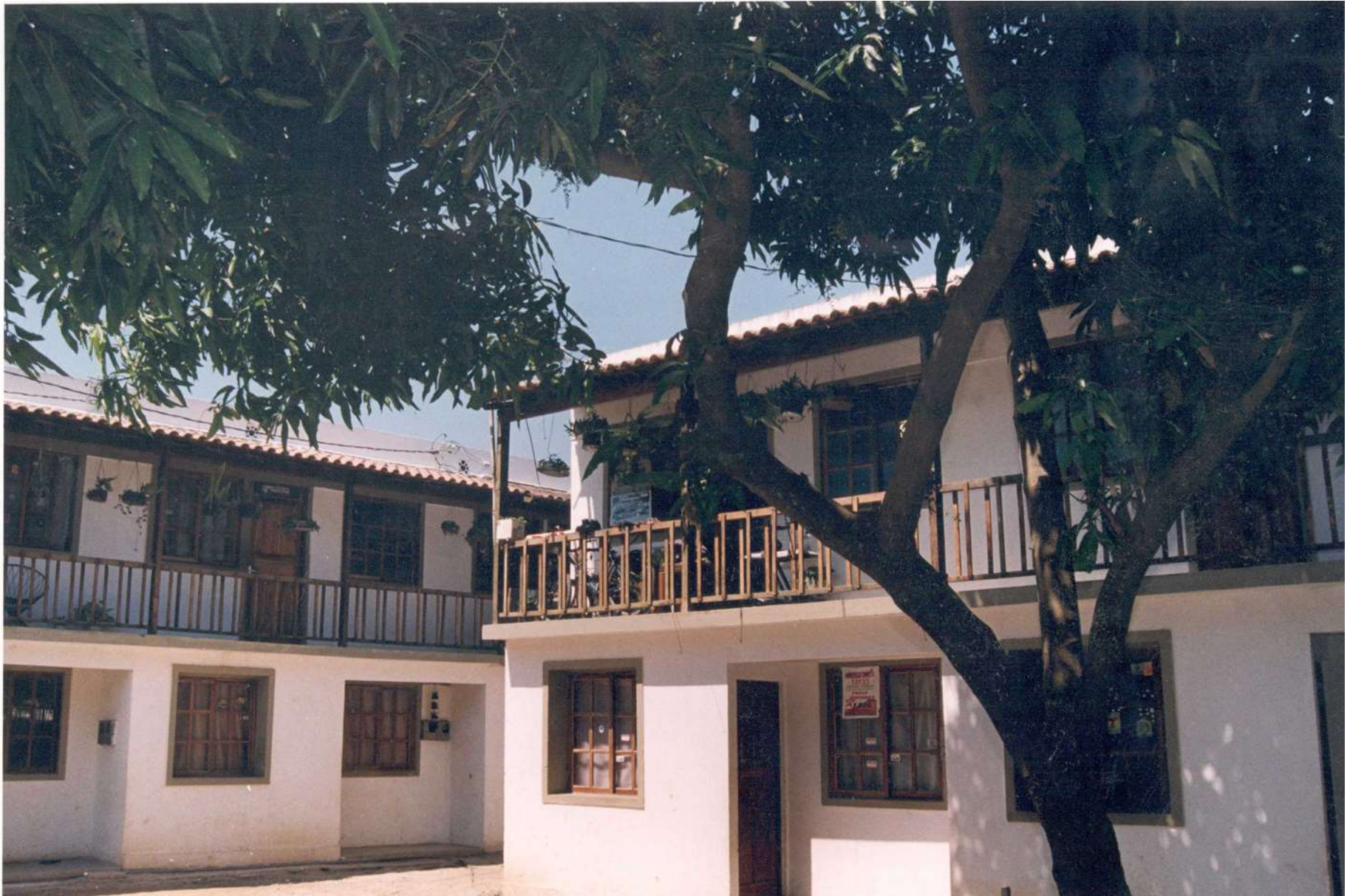
13. Encontro Nacional de Moradia Popular