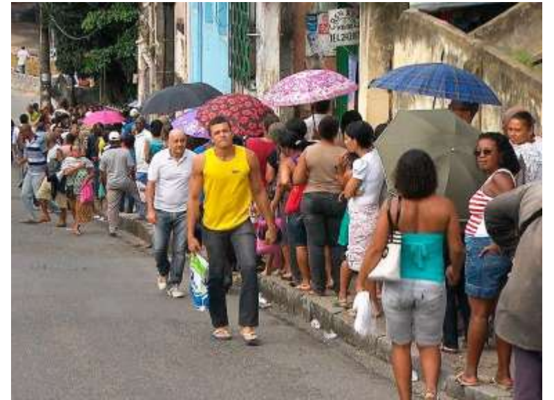
Nacional de Moradia Popular