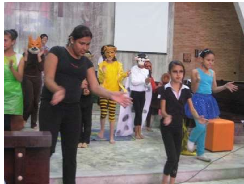
13. Encontro Nacional de Moradia Popular